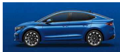
RACE BLUE METĀLISKA KRĀSA 730 €