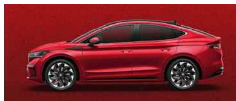
VELVET RED SPECIĀLĀ KRĀSA 1 200 €