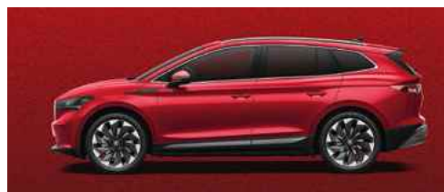
VELVET RED SPECIĀLĀ KRĀSA 1 200 €