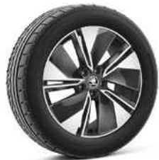
19" REGULUS antracīta metālika 210 €