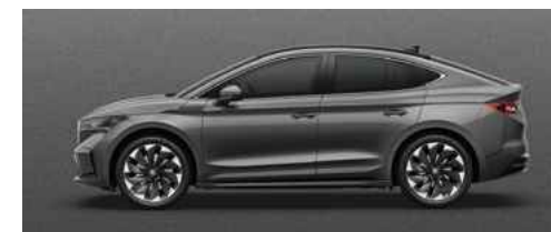
GRAPHITE GREY METĀLISKA KRĀSA 730 €