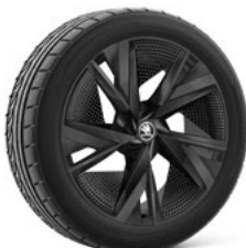
20" TAURUS BLACK AERO disku uzlikas