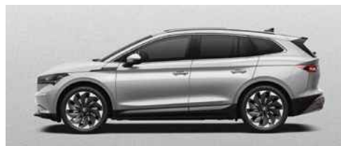
BRILLIANT SILVER METĀLISKA KRĀSA 730 €