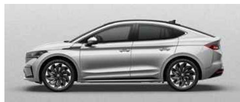
BRILLIANT SILVER METĀLISKA KRĀSA 730 €