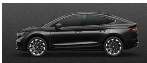
BLACK MAGIC PEARLESCENT METĀLISKA KRĀSA 730 €