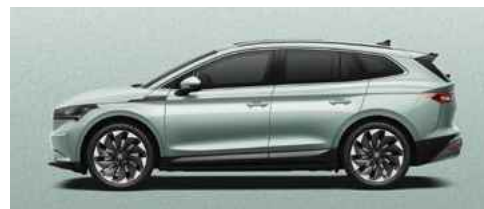
ARCTIC SILVER METĀLISKA KRĀSA 730 €