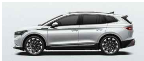
MOON WHITE METĀLISKA KRĀSA 730 €