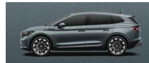
GRAPHITE GREY METĀLISKA KRĀSA 730 €