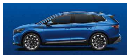
RACE BLUE METĀLISKA KRĀSA 730 €