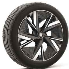
20" TAURUS 810 €