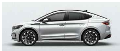
MOON WHITE METĀLISKA KRĀSA 730 €