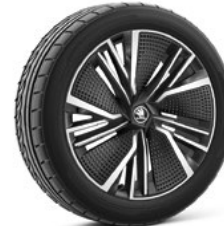
20" NEPTUNE AERO disku uzlikas 920 €