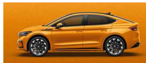
PHOENIX ORANGE METĀLISKA KRĀSA 730 €