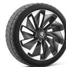
21" SUPERNOVA antracīta metālika 1 580 €