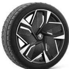
21" VISION AERO disku uzlikas 770 €