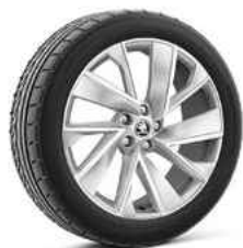
20" VEGA sudraba metālika 710€