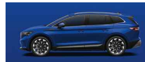
ENERGY-BLUE STANDARTA KRĀSA 0 €