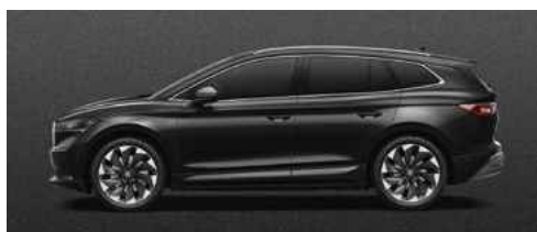
BLACK MAGIC PEARLESCENT METĀLISKA KRĀSA 730 €