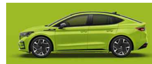
MAMBA GREEN STANDARTA KRĀSA 470 € (tikai RS)