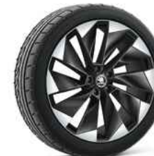
21" SUPERNOVA melna metālika 1 580 €